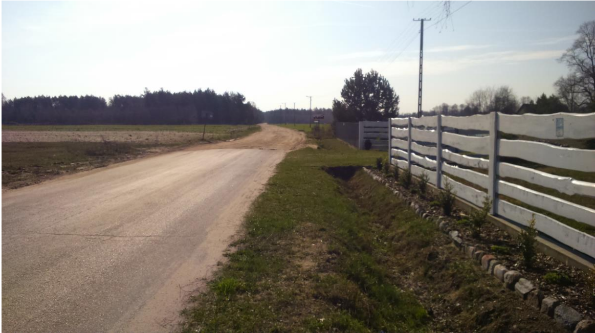
Zdjęcie 1 Istniejąca droga powiatowa nr 4328W o naw. asf. - początek inwestycji.

Obsługa przyległego terenu odbywa się przez zjazdy bezpośrednie.