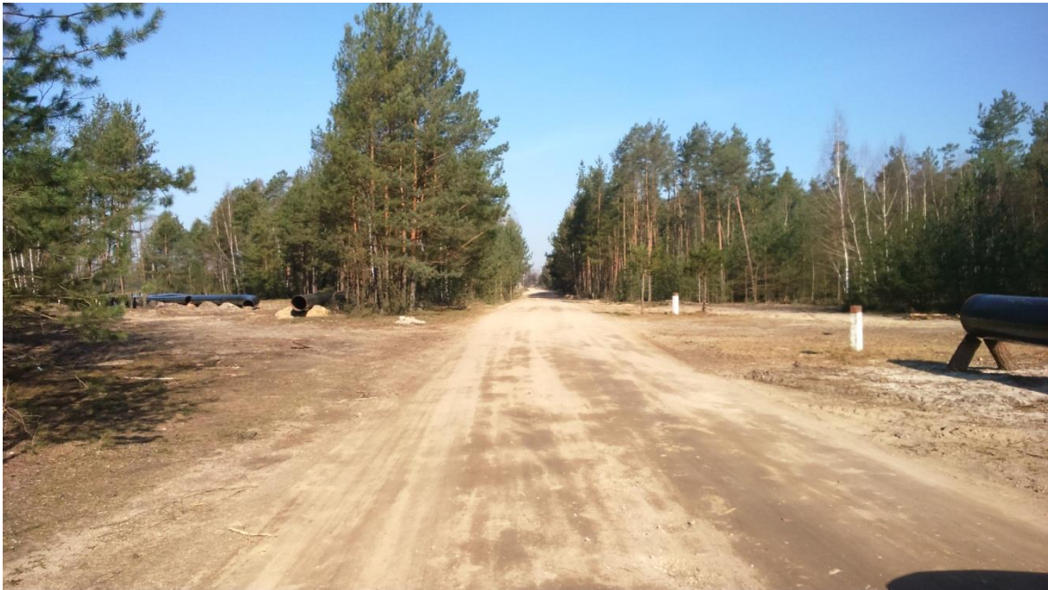
Zdjęcie 2 Droga powiatowa nr 4328W