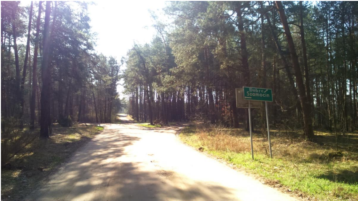
Zdjęcie 3 Droga powiatowa nr 4328W