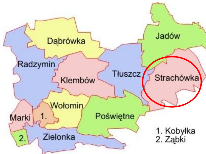
Rysunek 1 Mapa administracyjna powiatu wołomińskiego

Przewidziany do realizacji teren zlokalizowany jest na terenie gminy Strachówka, w powiecie wołomińskim, w województwie mazowieckim.