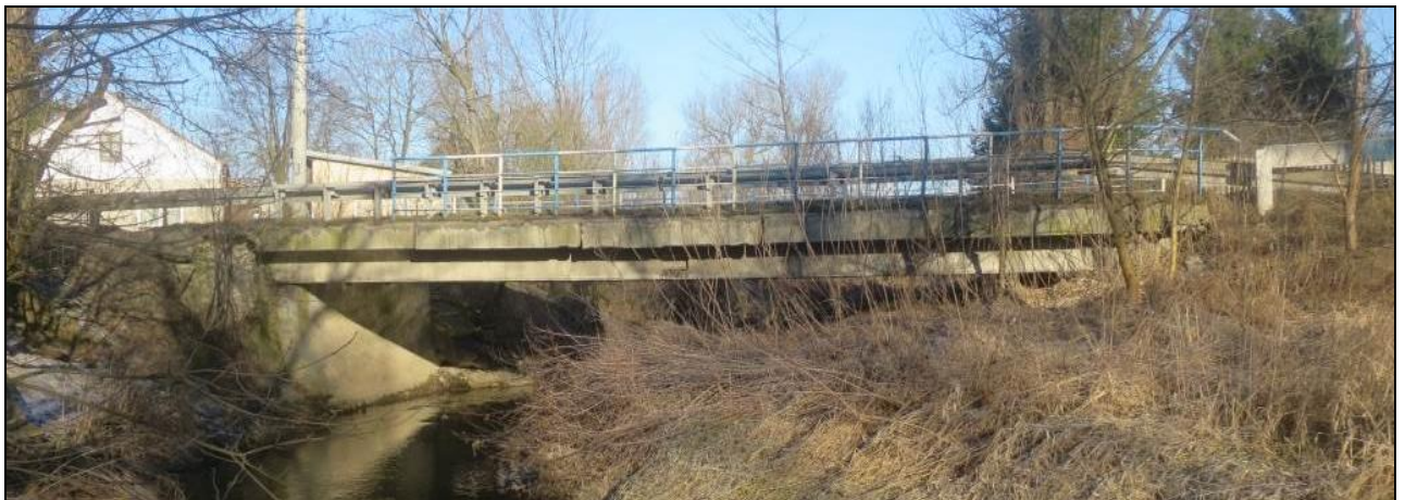
Rys. 2. Widok obiektu w terenie