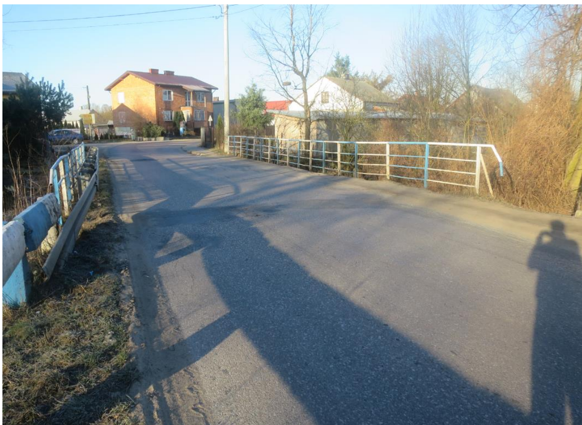
Rys. 3. Widok wjazdu na most od strony m. Stanisławów

Przedmiotowy obiekt jest drogowym mostem żelbetowym, o schemacie jednoprzęsłowej belki swobodnie-podpartej. Długość całkowita obiektu jest równa 18,70 m. Rozpiętość teoretyczna w osiach podparcia jest równa 14,70 m. Obiekt usytuowany jest jako prosty w planie.